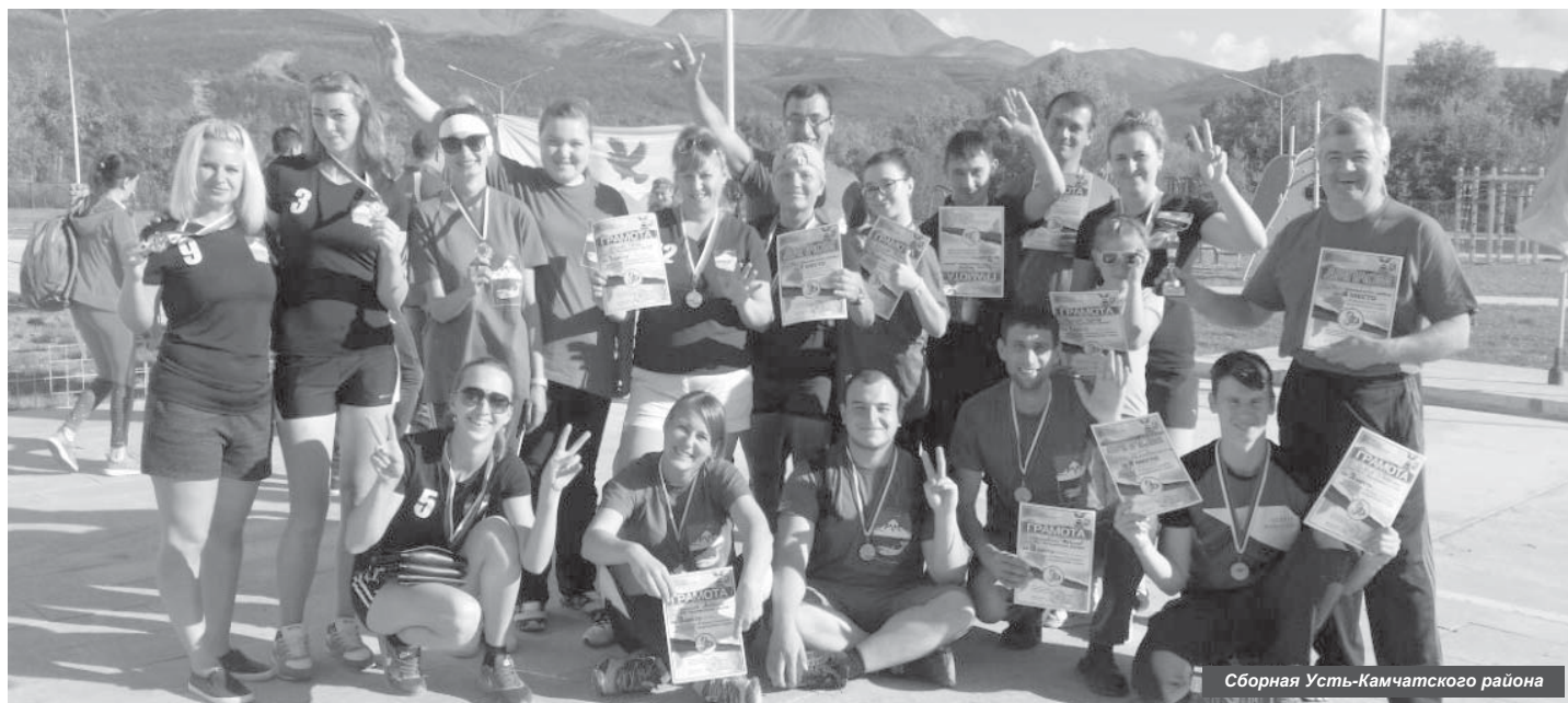
Сборная Усть-Камчатского района