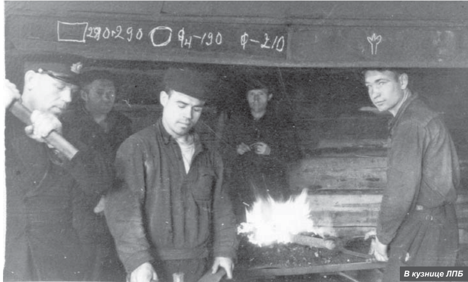
В кузнице ЛПБ