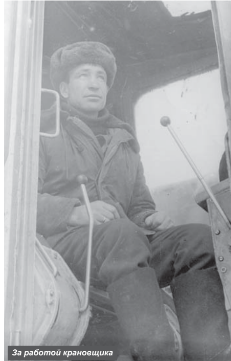
За работой крановщика